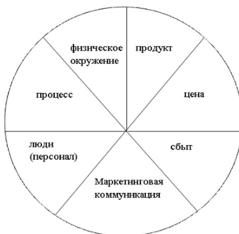
Рисунок 1 – Комплекс маркетинга 7Р

Анализируя внешнюю и внутреннюю среды организации ознакомиться с ситуацией и ответить на поставленные вопросы. ПК-9.1