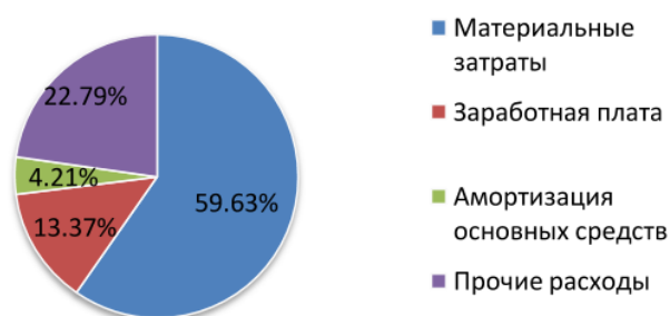
Рисунок 4 Фактическая структура затрат на производство продукции за отчетный год

Предприятие использует методику ценообразования «издержки + прибыль».