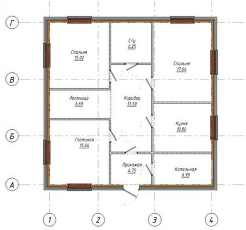
Рисунок 1 – План 1-го этажа малоэтажного жилого здания

С целью осуществления документального сопровождения работ и мероприятий контроля законченных видов и этапов строительных работ решить поставленные задачи (рисунок 1):