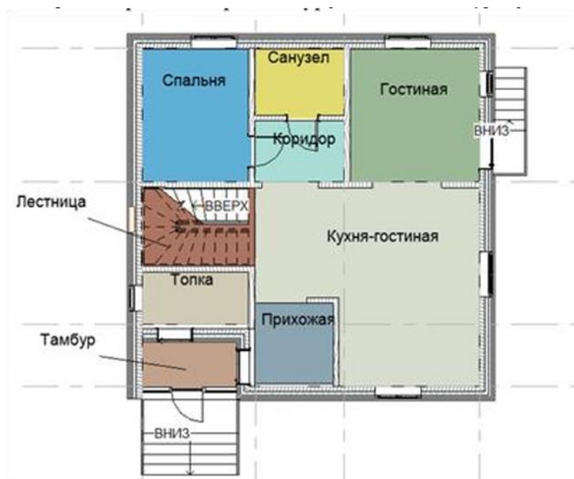
Рисунок 1 – План 1-го этажа малоэтажного жилого здания

С целью выбора и контроля требований и правил к производству строительных работ решите следующие задачи (рисунок 1):