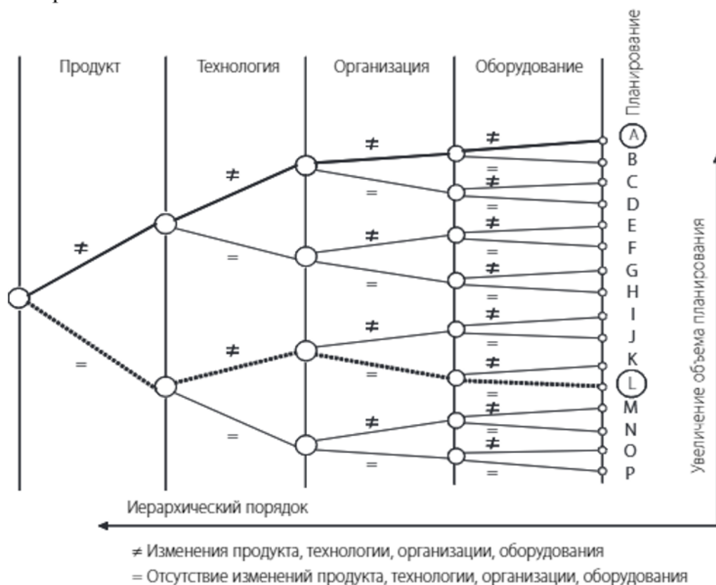
Рисунок 1 – Основные стратегии организационного проектирования производства

Задание 1: При проектировании имеющегося производства предприятие может исходить из ряда стратегий организационного проектирования. На рисунке 1 представлена структура стратегий организационного проектирования производства в зависимости от иерархии в архитектуре предприятия и трудоемкости плано-проектных расчетов.