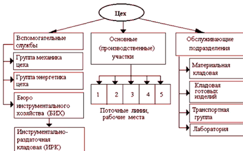
Рисунок 3 – Функциональные области цеха