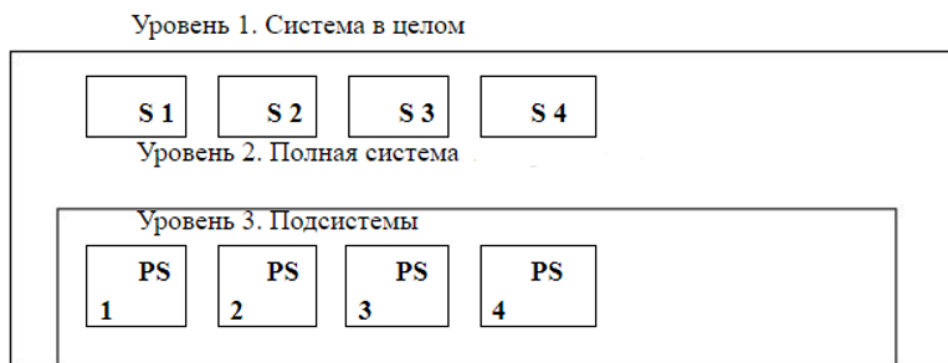
Рис.1. Представление уровней системы; S1, S2 и т.д. – внешние системы, учитываемые при решении задачи; PS1, PS2 и т.д. – подсистемы устройства.