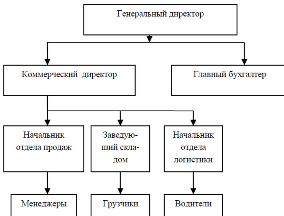
Рисунок 1 - Организационная структура управления ООО «ОФ Юнрос»

На рисунке 1 представлена организационная структура ООО «ОФ Юнрос».